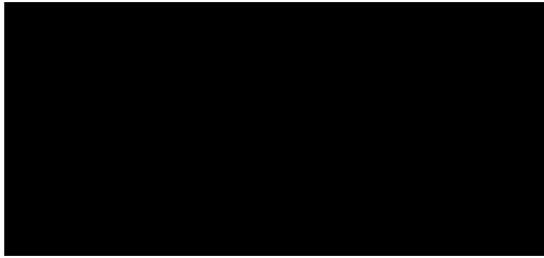
Ilustrasi Catal Huyuk Farming