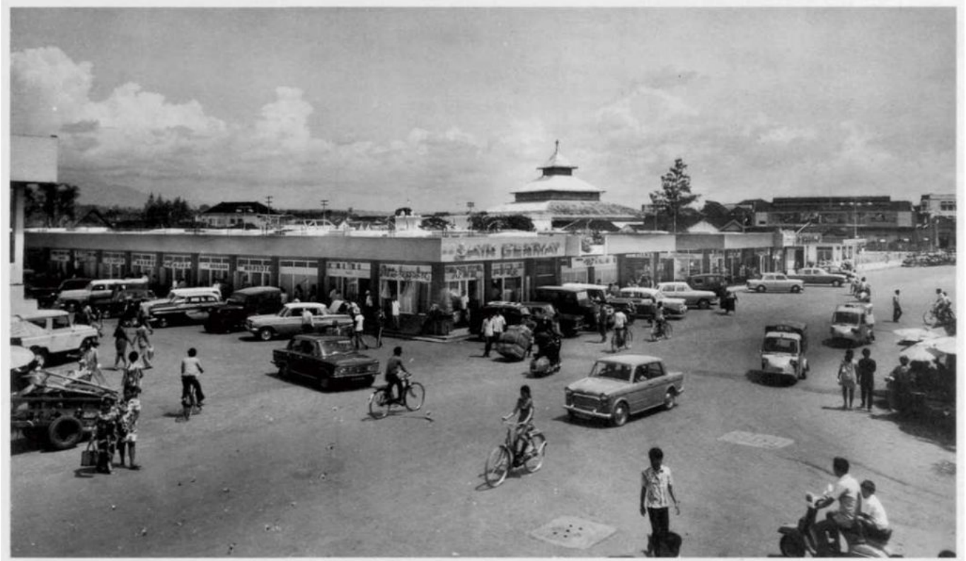
De verdwijnende Aloon-Aloon, eindjaren zestig gezien in zuidwestelijke richting vanaf Jl. H. Agus Salmi, hier voorheen de Aloon-Aloon Midden.

Ditulis oleh Alif.ID pada Rabu, 01 November 2017